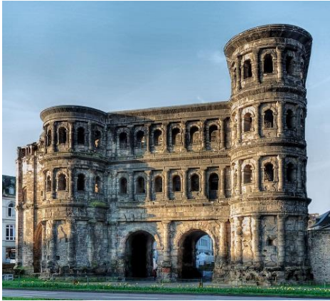
Abbildung 2

Die Herbsttagung der Kulturwarte des Eifelvereins findet am 12.11.2022 in Herforst (bei Speicher) statt (10:00 - 15:30 Uhr).